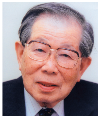
パネリスト ひのほら しげあき 日野原 重明氏 聖路加国際病院理事長