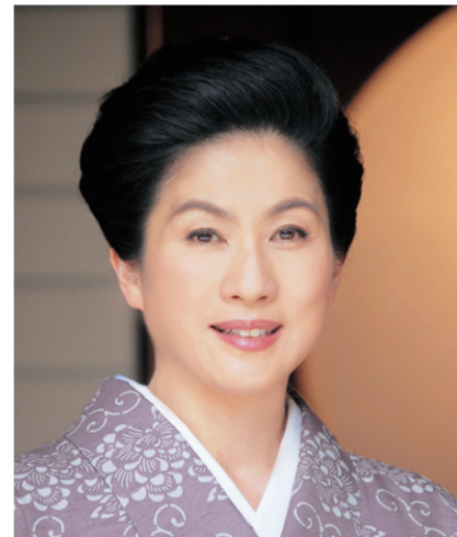
パネリスト まや きょうこ 真野 響子氏 女優